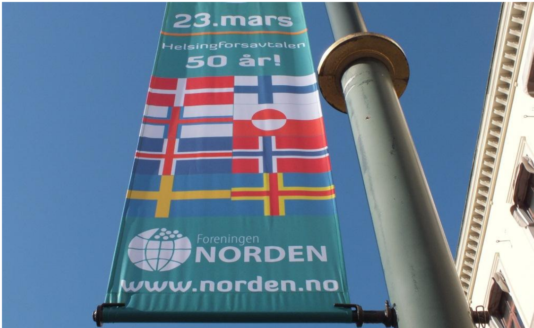
Den 23 mars är Nordens dag. Det markerades bland annat på Karl Johan i Oslo.